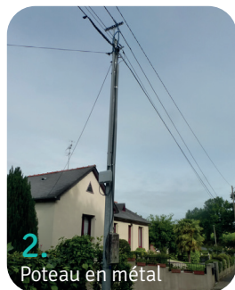
2. Poteau en métal

► Les fourreaux qui sont des gaines enterrées dans lesquelles sont passés les câbles.