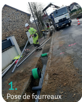
1. Pose de fourreaux

Elles sont principalement de deux sortes :