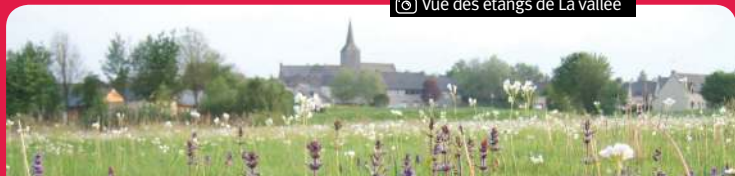
© Vue des étangs de La vallée

bois, empruntez à droite un chemin empierré. Suivez la route à gauche sur 300 m puis, prenez la première route à droite en direction du Tertre Guy. 4 Dans le virage à la ferme du Tertre Guy, tournez à gauche. La grande allée empierrée se poursuit par un chemin de terre boisé. À la sortie du bois, un chemin pierreux vous conduit aux Renardières. Sur la route, tournez à droite et traversez le hameau (habitat local en granit). 5 Après le pont qui surplombe le ruisseau, engagez-vous sur le chemin empierré à votre droite (croix du pont des Renardières). Il se prolonge par un chemin de terre en sous-bois. Au croisement, tournez à droite puis à gauche. Vous cheminez dans une zone bocagère. Traversez la route et pénétrez dans le bois en face. 6 À la première intersection, tournez à gauche, et à la suivante, continuez en face. À la sortie du bois, empruntez le chemin à droite vers La Morvonnais et regardez le bourg par le même itinéraire qu'à l'aller.