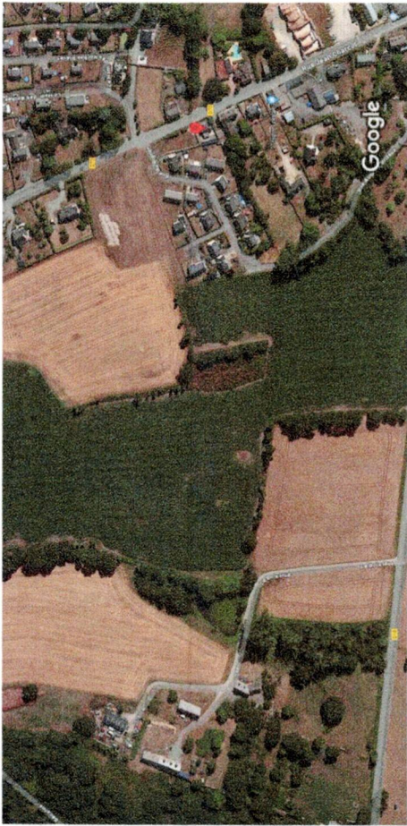
20 m